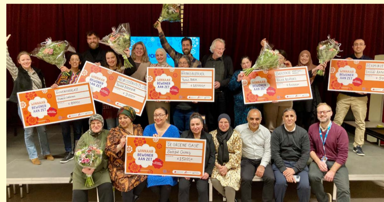
Op de foto de winnaars van de vorige Bewoner aan Zet.

Lever het plan in voor 1 december via www.bewoneraanzet.nl . Op deze website zie je hoe het werkt. En voorbeelden van eerdere plannen.